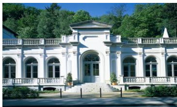
Museum Kurhaus Kleve