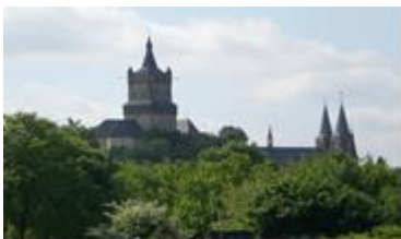
Schwanenburg & Stiftskirche

Treten Sie ihren Weg nun zurück in die Stadt an. Hier auf der Tiergartenstraße zeigt sich die ehemalige Pracht der Herzogstadt: Liebevoll restaurierte, klassizistische Villen mit verwunschenen Gärten, die im Laufe ihrer Geschichte die unterschiedlichsten Bewohner beherbergt haben. Zuallererst die Villa Belriguardo , in der sich nicht nur Designermode erwerben lässt, sondern auch zahlreiche Antiquitäten und Einrichtungsgegenstände. Das kleine, weiße Haus an der Einmündung des Rinderschen Deiches ist die ehemalige Oberförsterei. An der großen Kreuzung mit der Gruftstraße steht Haus Nienhuisen, das aber in Kleve alle nur als Fuji Villa kennen, denn aus Freude über die Ansiedlung eines Weltunternehmens in Kleve stellte die Stadt die Villa als Gästehaus zur Verfügung. Heute ist die Villa wieder in Privatbesitz. Gegenüber die Villa Nova oder Haus Dorsewagen. Nach umfangreicher Renovierung strahlen die alten Räume nun mit dem Garten um die Wette. Besonders sehenswert der kleine Ballsaal mit seiner aufwendigen Deckenmalerei. Heute ist dort ein Gastronomiebetrieb zu finden. Überqueren Sie die Kreuzung, finden Sie bald das Emmaushaus . Der prächtige Bau hat seine gelbe Farbe heute nicht zu Unrecht, denn in ihm residiert auch die FDP.