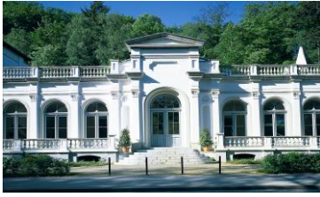
Museum Kurhaus Kleve