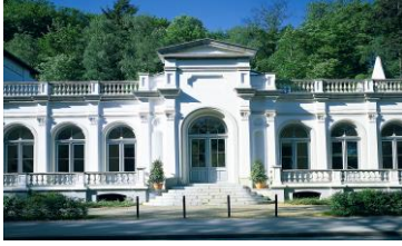
Museum Kurhaus Kleve