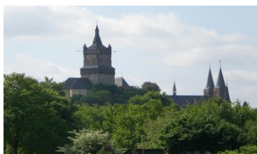
Zwanenburcht & Stiftskirche