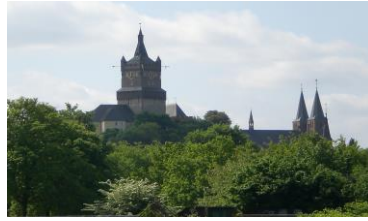
Zwanenburcht & Stiftskirche