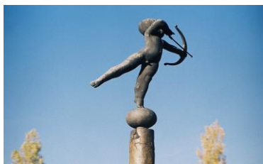
Zuil van Cupido