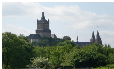
Zwanenburcht & Stiftskirche