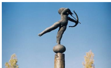
Zuil van Cupido

U volgt de Johan Maurits wandelroute , het riviertje aan uw linkerhand, tot aan de plek waar de rivier door een aardverschuiving is versmald. Hier, bij de 'smalle hals', vormt de Luisenbrücke sinds 2005 een verbinding met de Galleien. Koningin Louise van Pruisen maakte als 16-jarige prinses in 1791 een studiereis naar de Niederrhein en Nederland, en was laaiend enthousiast over Kleef. Vanaf het midden van de brug vormt de Zwanenburcht een prachtig fotomotief. Uw route loopt echter niet over de brug, maar over de kronkelende trappen de heuvel op.